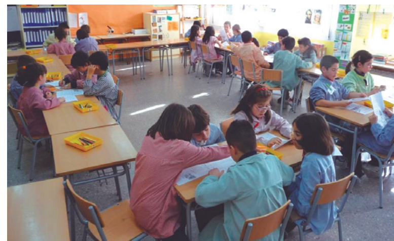
Imagen 1. Alumnado de 3.º trabajando eficacia lectora

A fin de dar respuesta a las preguntas de comprensión, se utiliza la técnica «lápices al centro». Un alumno lee la pregunta en voz alta y da la respuesta, pidiendo la opinión de sus compañeros y compañeras de equipo. Se intercambian las opiniones y, entre todos, se decide la respuesta que creen más adecuada. A continuación, todos los miembros del equipo la escriben (imagen 1).