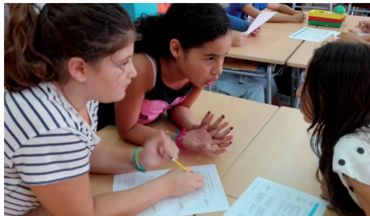
Imagen 4. Evaluamos a nuestros compañeros y compañeras

después, se calcula la media que da nota al equipo.