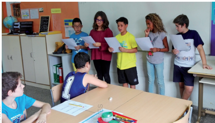
Imagen 3. Leemos para nuestros compañeros y compañeras