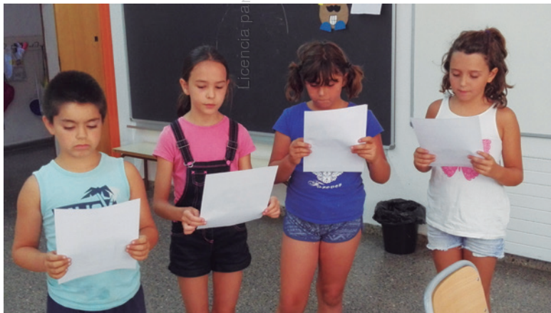
Imagen 2. Preparando la lectura

En la escuela hacemos cada día 30 minutos de lectura. Las maestras leen un libro del autor que se trabaja, y el alumnado recomienda y hace la crítica de lo que ha leído individualmente. Se ofrece